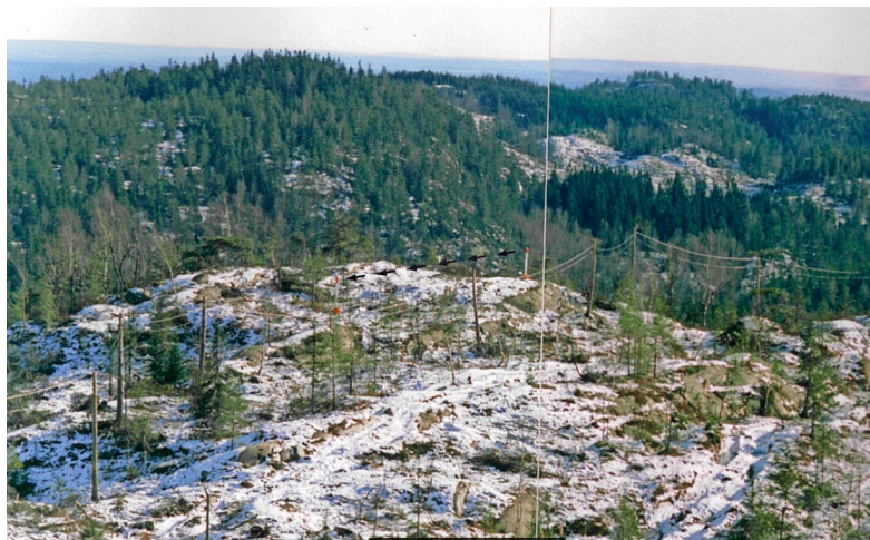
Figur 6.3 Siktmåler Stikkvannskollen (mot sørøst fra radiotårn).

forhold ble senere bekreftet og støttet av flere uavhengige institusjoner og granskningskommisjoner.