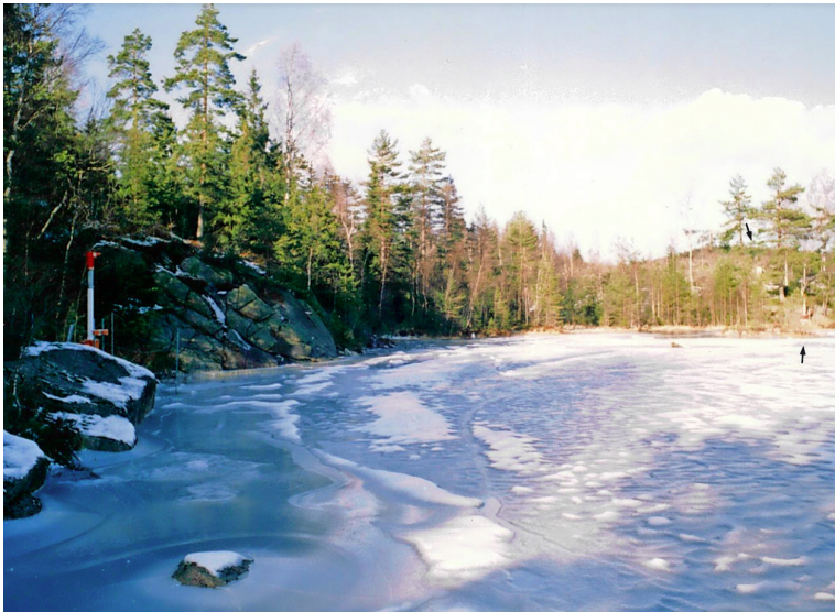
Figur 6.5 Siktmåler og skyhøydemåler (bakre pil) ved Stikkvann (mot nord).