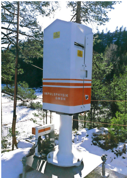
Figur 6.6 Skyhøydemåler ved Stikkvann (mot sørvest).