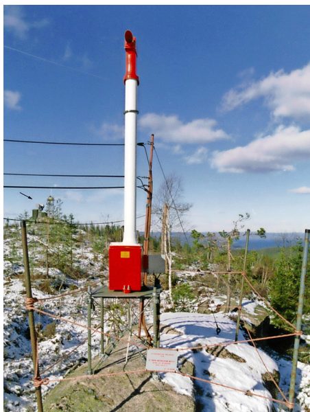
Figur 6.2 Siktmåler (sender) på Stikkvannskollen (radiotårn i bakgrunnen mot nord). Foto: Drammen politikammer, mars 1990.

med den fremste teknologi på feltet. Sikten ble målt med et transmissometer, et instrument som består av en sender og en mottaker av lys med avstand valgt til 45 m på Hurum.