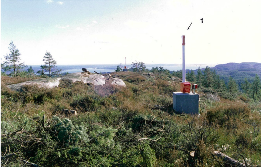
Figur 6.1 Siktmåler på St. Hansberget. Foto: Drammen politikammer, 1990.

I denne 30-årsperioden er det fremkommet en rekke uriktige påstander om måleprosjektet på Hurum i aviser og media. De mest alvorlige er presentert i NRK-programmer på slutten av 1990-tallet og i flere bøker. Og nå i 2020 om Jan Wiborgs engasjement rundt siktmålingene på Hurum gjennom seks episoder av TVNorges produksjon.