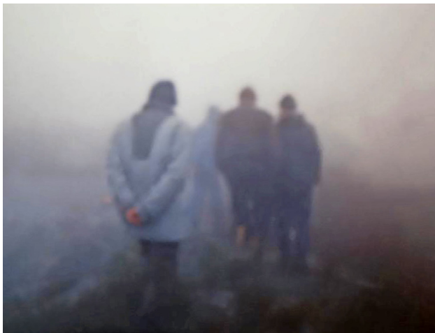
Figur 6.8 Bekymrede meteorologer på befaring i Hurum-tåka.

Bildet i figur 6.8 viser svenske og norske meteorologer under en befaring på Stikkvannskollen i «dette berømmelege tåkehavet».