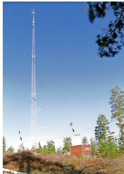
Figur 6.7 Siktmåler og vindmast på Nilsåsen (mot nord).